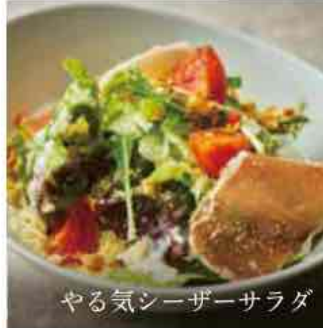
やる気シーザーサラダ