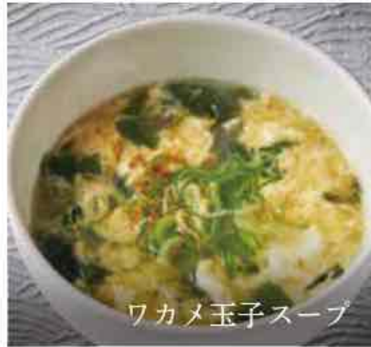
ワカメ玉子スープ