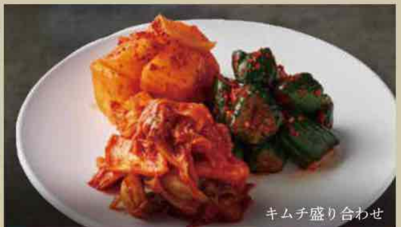
キムチ盛り合わせ