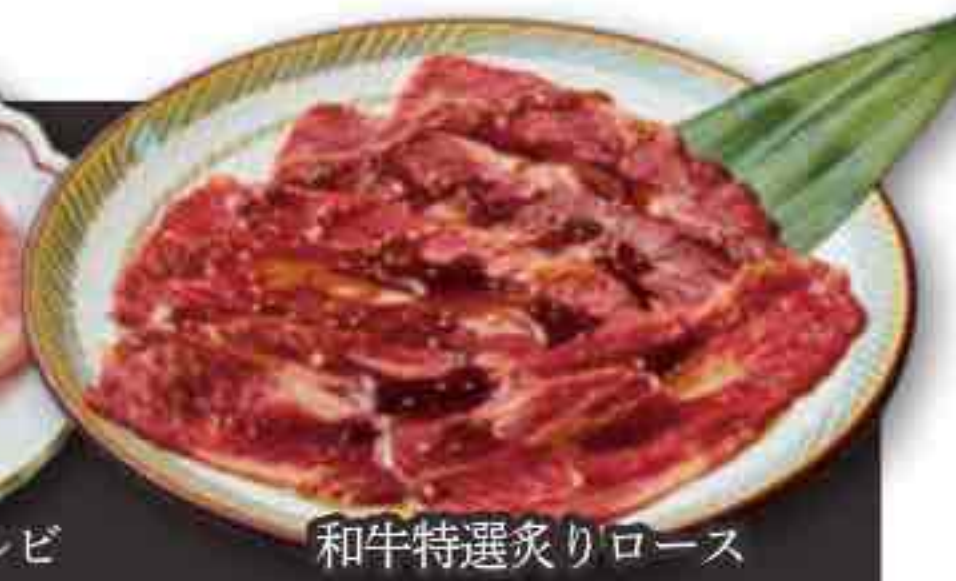
和牛特選炙りロース