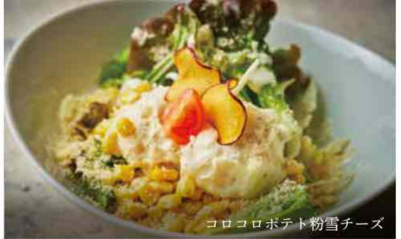
コロコロポテト粉雪チーズ