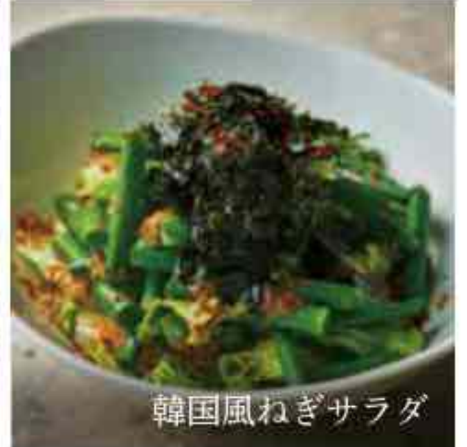
韓国風ねぎサラダ