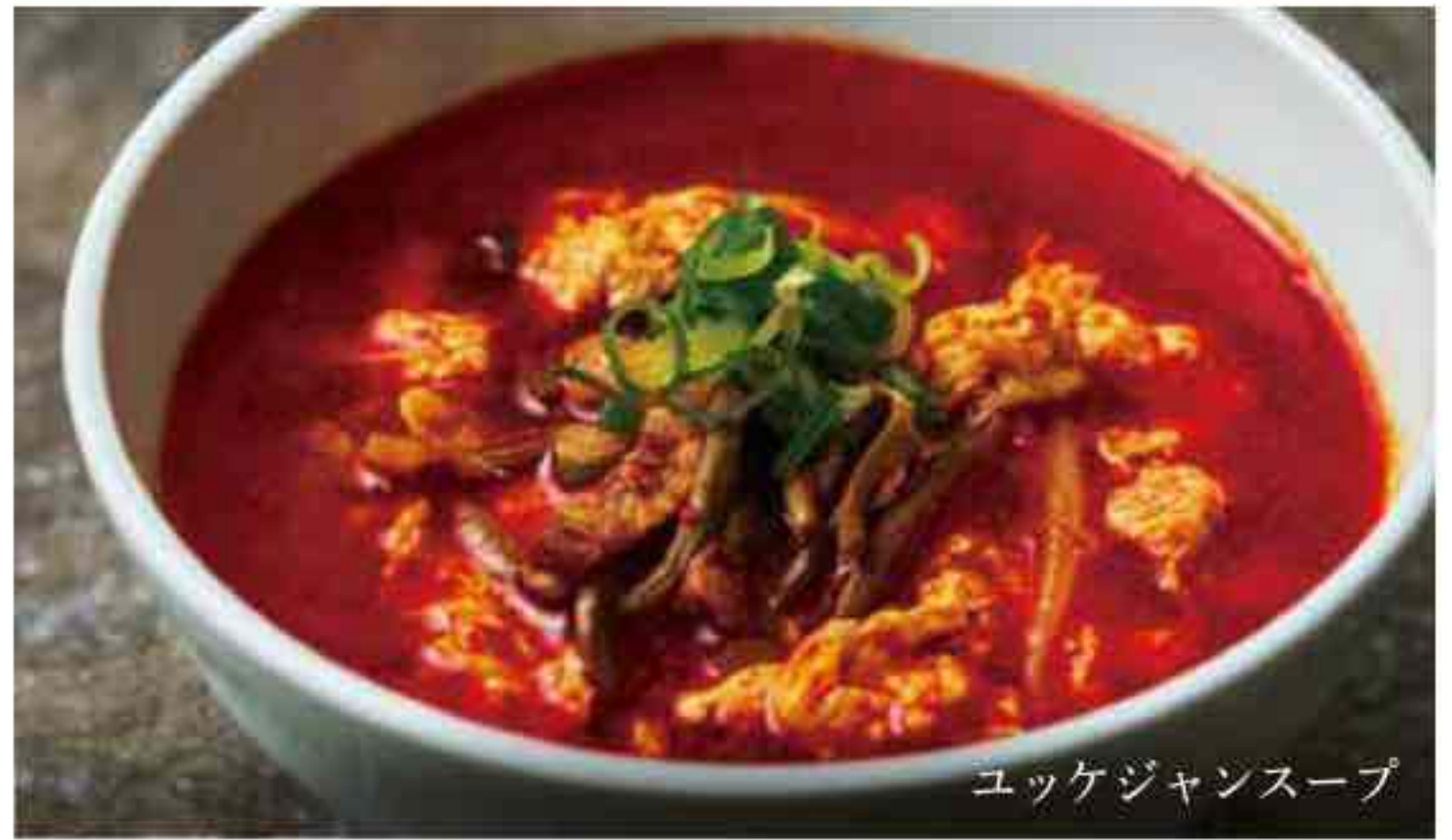
ユッケジャンスープ