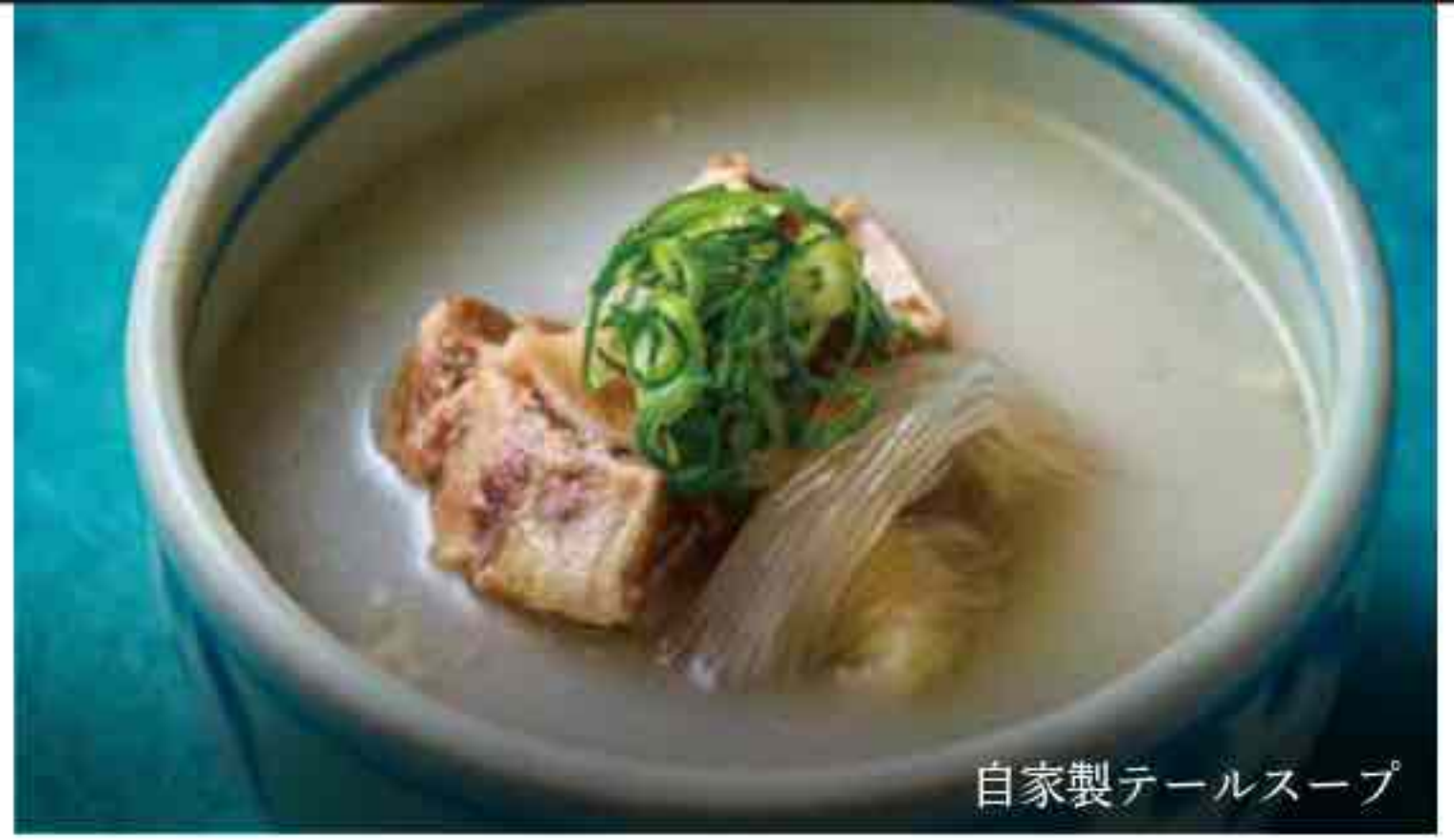
自家製テールスープ