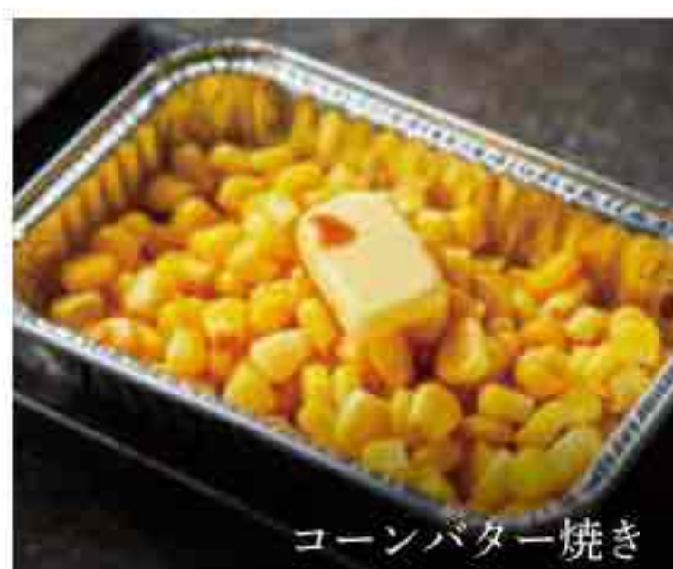
コーンバター焼き