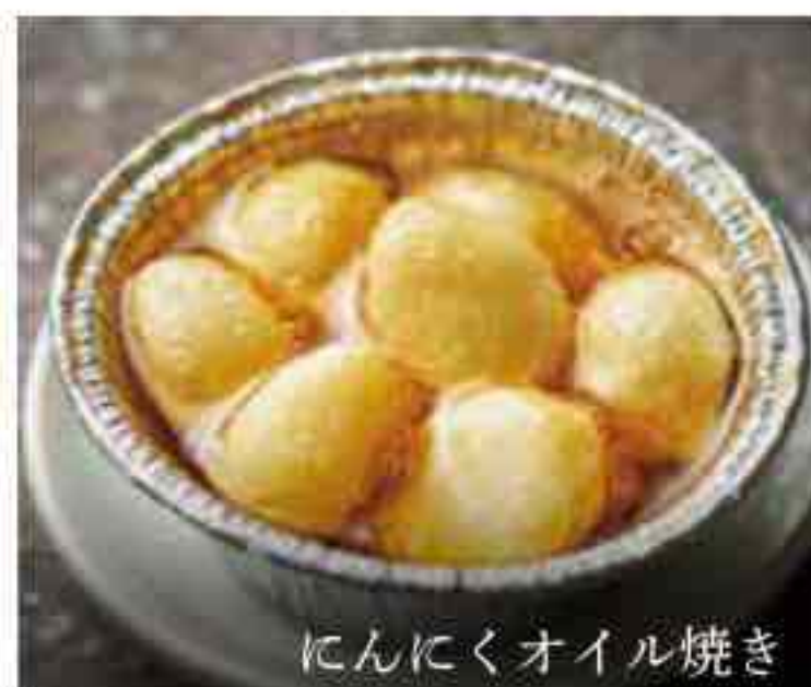
にんにくオイル焼き